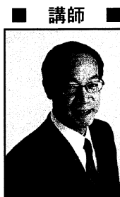
■ 講師 ■